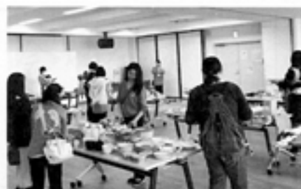
欲しい商品に付箋をはります♪