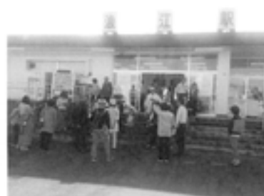
▲昨年の企画のようす。浪江駅の前で