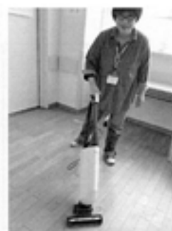
家電ゲットしました♡