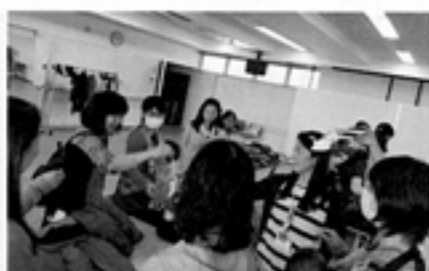
くじ・じゃんけんにドキドキする～☆