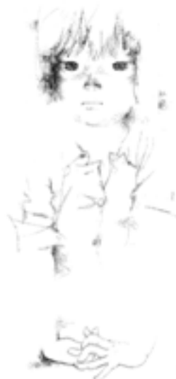
いねまきひろ 見つめる少女 『わたしが思いがかったとき』(童心社) 1978