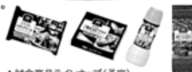
▲試食商品ラインナップ(予定)