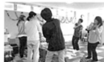
▲「笑いヨガ」のようす