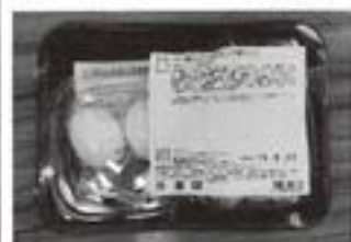
レシピと材料がセット