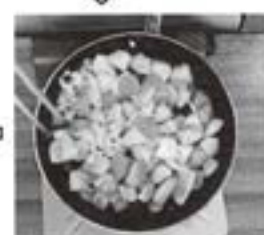
たけのこ、ピーマン、豚肉を入れて炒める