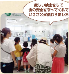
厳しい検査をして食の安全を守ってくれていることが伝わりました

コープデリグループでは「食の安全」のためのさまざまな取り組みを進めています。食べ物が口に入るまで“安全”であるためには家庭での手洗いや食材の温度管理なども重要です。コープデリ商品検査センターでは、2018年のリニューアルを機にコミュニケーション機能を強化、科学的知見を基にした食育プログラムを実施しています。学習+実験を通じて、食の安全を自分のこととして捉えることができます。