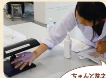
ちゃんと洗えていると思っていたの!? エヘッ、全然ダメだ〜!

汚れに見立てた蛍光ローションを手に塗り、その後ハンドソープで普段通り手洗い。その手をブラックライトにかざすと……洗い流せなかったローションが光り、洗い残しわかります!