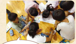
これから給食や家での食事は食べ残さないようにしたい

先進国やアフリカなどに食料を分配するゲームで世界の食料の不公平さを学びます。日本では多くの食品ロスを出しており、自分に何ができるかをグループで考えます。