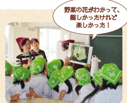
野菜の花がわかって、楽しかったけれど楽しかった!