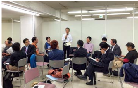
(写真上)センターから遠方の災害現場へはバスで送迎 (写真下)さまざまな団体が一緒に課題に対応するため、会議で情報を共有