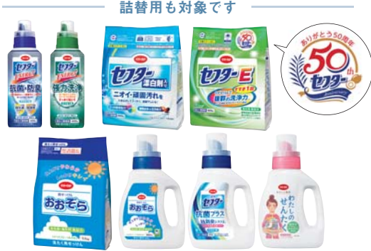
詰替用も対象です