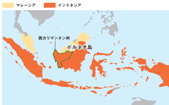
世界の生産量の85%がインドネシア・マレーシアで生産されている