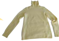
カシミアのセーター