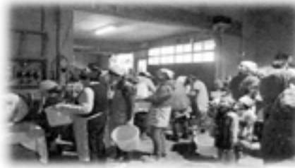
みんな並んで材料を受け取ります。 まずは、塩と糶と水を混ぜて～ 混ぜて～