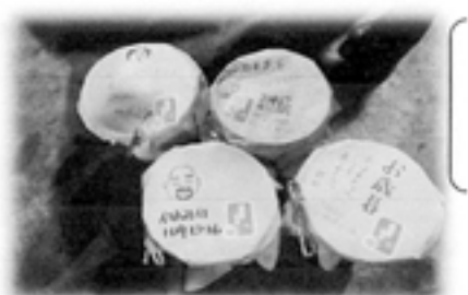
沢山作って、おいしいちゃん、 おばあちゃんにお歳暮として 贈られるご家族も！ ナイスアイデア！ですね。