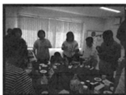
＜お餅のたまり場の様子＞

最後に別室にて、お餅の食べ方や ちよと変わったメニューを紹介して頂き、 お腹いっぱいになりました。参加者の 皆さんと たいまつ食品の皆さんと楽しい 交流のひとときを過ごしました。