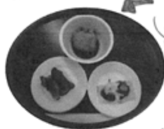
＜一風変わったメニューの試食＞

豪華! お土産付でした。 ・特別栽培米 こがねもち ・フルーツヨシレ 2種 ・米糎