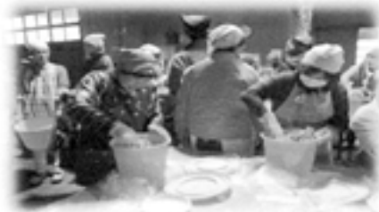
大豆を美味しくなるように、思いを 込めてよ～く混ぜて！ 空気を抜いて、丁寧に仕上げていき ます。