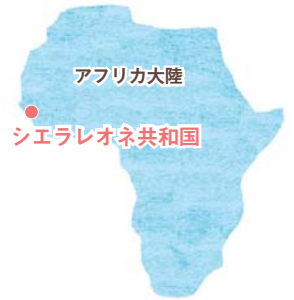
アフリカ大陸 シエラレオネ共和国 シエラレオネは西アフリカに位置。人口およそ700万人のうち、約半数が子どもです

5月にコープの職員が、現地の保健センターや住民が暮らす村を訪れました。支援は進んでいましたが、栄養不良の子どもはまだ多く、取り組みの継続が必要です。支援の様子をお伝えします。