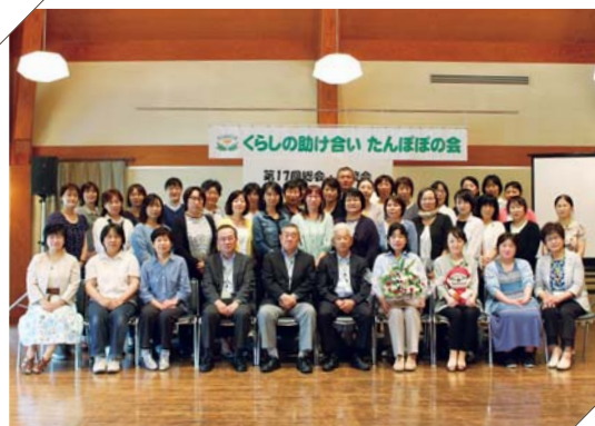
▲総会に参加された皆さん

記念撮影後の交流会では、お弁当を食べながら、日頃の活動についてや会への思いなどが語られていました。